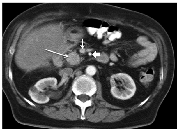
Figura 1. Tomografía axial computarizada de abdomen con contraste endovenoso. Se observa el tumor en la cabeza del páncreas (flecha blanca larga) y su relación con la vena mesentérica superior (flecha blanca corta) y la arteria mesentérica superior (cabeza de flecha). Ambas estructuras vasculares se encuentran, en este caso, libres de tumor.

T, tumor primario; N, ganglios; M, metástasis; VMS, vena mesentérica superior; AMS, arteria mesentérica superior.